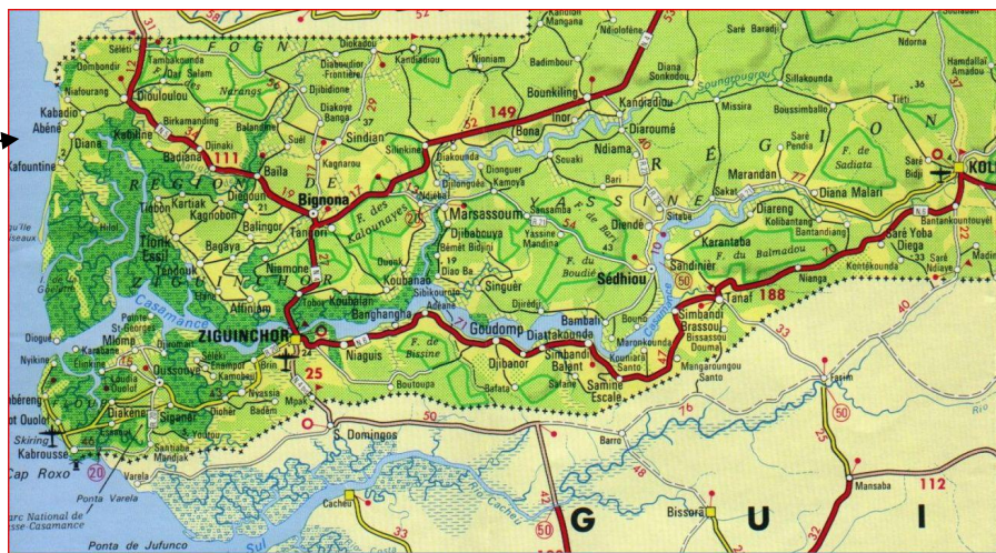
Regio Casamance in Zuid Senegal, met aanduiding projectlocatie Abéné