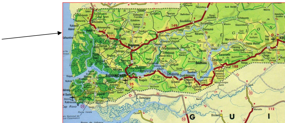
Regio Casamance in Zuid Senegal, met aanduiding projectlocatie Abéné