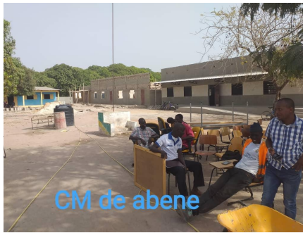
De school voor voortgezet onderwijs (CM) kreeg leerlingensets, schoolborden en enkele kasten.