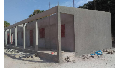
Begin februari werd de vloer afgesmeerd en werd de buitenkant met een laag cement bespoten.