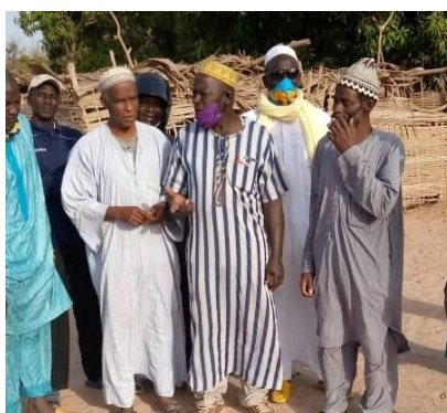
Dorpschef (rechts) met dorpsraad

In de periode vóór het regenseizoen werd de fundering voor de drie klaslokalen gelegd. Voorafgaand aan de start kwam de dorpschef met de dorpsnotabelen (de dorpsraad) naar de schoollocatie om een besluit te nemen over de plaats waar de nieuwe klaslokalen zouden komen. Dit was een formele activiteit omdat het de dorpsraad is die formeel het besluit had genomen tot de bouw van een 2e lagere school. Op de foto's is te zien dat het dragen van mondkmaskers in die tijd begon.