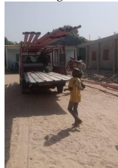
Het materiaal voor de dakconstructie werd op 14 februari 2021 op het terrein afgeleverd.