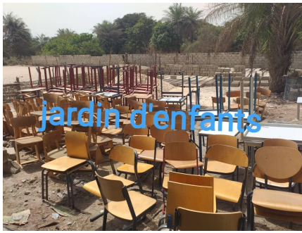
Kleinere stoeltjes gingen naar twee peuterspeelzalen. 1 bevindt zich op het terrein van de 2e lagere school.