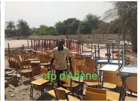
De technische school (CFP) kreeg ook leerlingensets, en enkele schoolborden en kasten.

De scholen waren zeer blij met de geboden ondersteuning voor het onderwijs dat ze vaak in moeilijke omstandigheden bieden. Het meubilair levert een aanzienlijke verbetering op voor de leer- en werkomstandigheden van leerlingen en docenten. De directeurs van de betrokken scholen hadden een dankbrief opgesteld. Van de brief van de directeur van de lagere school is hierna een foto opgenomen en van alle brieven de vertaling.