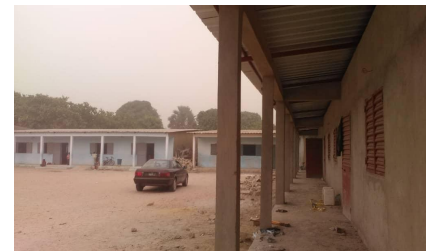
Op 18 februari was de dakconstructie klaar. Het gebouw werd aan de achterkant en de zijkanten met een cementlaag is bespoten. De voorkant wordt later, tegelijk met het binnenschilderwerk, met gekleurde cement bespoten