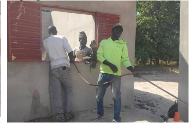
In januari werden de metalen ramen en deuren geplaatst en werd de elektra verder afgewerkt