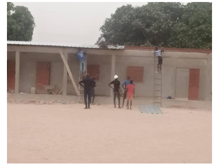
Op 17 februari was de constructie van het dak tot de helft van het gebouw gevorderd.